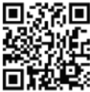
ምዝገባ ወለድን ኮም?

http://tinyurl.com/DCSD-Parent-CommunityFG